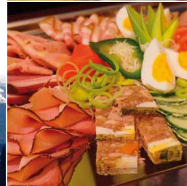
Partybreze, Käse- & Heringbutterbrötchen, Mischplatte